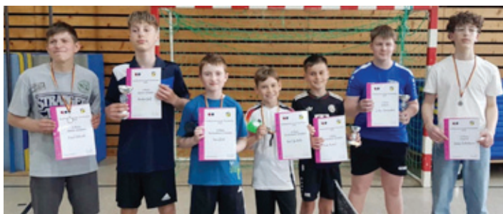
Die Sieger und Platzierten bei den Schülern und der Jugend