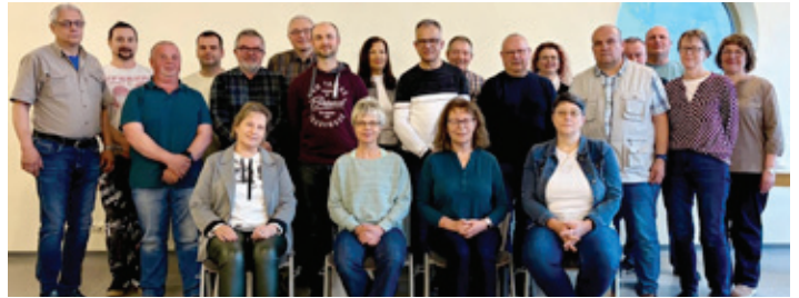
Ehrung für die Jubiläumsblutspenderinnen und -spender

Mitte April wurden in Klingenthal die Jubiläumsblutspenderinnen und -spender aus dem Jahr 2025 durch die DRK Kreisverbände Klingenthal und Oelsnitz sowie das Institut für Transfusionsmedizin Plauen für ihr selbstloses Engagement ausgezeichnet. Insgesamt 42 Spenderinnen und Spender konnten die Ehrung für 50, 75 und 100 Blutspenden entgegennehmen.