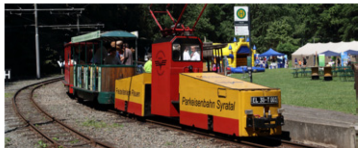
Viel zu entdecken gibt es beim 5. Verkehrstag

Am 13. Juni lädt der Verkehrsverbund Vogtland von 12:00 bis 18:00 Uhr Groß und Klein zum 5. Verkehrstag ein. Der Tag steht ganz im Zeichen von Mobilität und Spaß. Ein abwechslungsreiches Familienfest mit vielen Attraktionen erwartet die Besucher: In der Busschule für Groß und Klein kann jeder ausprobieren, wie sicheres und barrierefreies Busfahren funktioniert. Der Zugfahrersimulator der Vogtlandbahn nimmt die Gäste mit auf eine virtuelle Bahnfahrt. Junge Entdecker können an den vielfältigen Stationen des „Neugier Express“ experimentieren und staunen. Für Action sorgen XXL Fußballdart, Hüpfburg und ein Radparcours. Auch Clown Carlotta sowie die Maskottchen Trami und Capy sind mit dabei. Alle Attraktionen der Freizeitanlage, Parkeisenbahn, Minicars, Minigolf und TrickPin können an diesem Tag kostenfrei genutzt werden. Weitere Informationen sind auch unter www.vogtlandauskunft.de erhältlich.