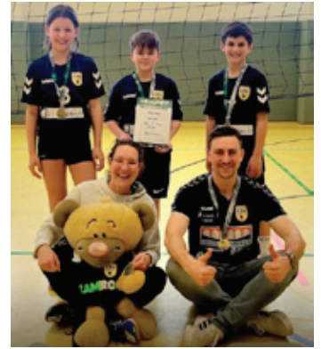
Sind noch in Erfurt bei den „Masters“ gefordert: die U12 des VSV