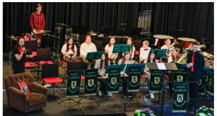
Märchenhaft ging es beim Frühlingskonzert zu