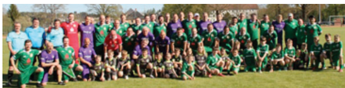
Die Allstars-Mannschaft des FC Erzgebirge Aue sorgte für gute Unterhaltung