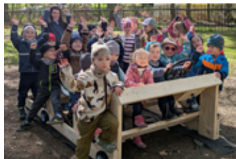
Das neue Holzauto fand regen Zuspruch

Im April beteiligte sich die Kita „Kinderlachen“ erneut an der Frühjahrsputzaktion „Gemeinsam geht's besser!“ der Sternquell Brauerei. Eltern säuberten Außengelände, entfernten Unkraut und bauten neue Highlights wie ein Holzauto und eine Murmelbahn. Dank Materialspenden von Kaiser Holz und Anlop entstanden ein großes Holzauto mit Sitzen und Lenkrad und eine tolle Murmelbahnwand. Ein engagierter Vater organisierte die Holzspende. Die Kinder und Erzieher möchten sich an dieser Stelle bei allen Unterstützern und Helfern bedanken.