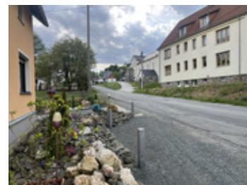
Eine der marodesten Straßen im Vogtland wird grundhaft erneuert. Im Bereich zwischen Abzweig Schule und Bürgerhaus, den unser Bild zeigt, wird ein Fußweg entstehen.

Darauf haben nicht nur die Eichigter lange gewartet. Die seit Jahrzehnten marode Ortsdurchfahrt (Kreisstraße 7850) wird zwischen Höhe und Abzweig Bergen auf einer Länge von 1,25 Kilometer vom Landkreis grundhaft ausgebaut. Das schließt den kompletten Neubau der Straßenentwässerung ein. Der Baubeginn steht unmittelbar bevor. Parallel zum Straßenbau wird die Gemeinde den Lochbach renaturieren und zwischen Bürgerhaus Abzweig Schule/Kita/Oswald-Breitenfelder-Sportplatz einen Fußweg bauen. Die Arbeiten werden sich voraussichtlich bis Ende 2027 hinziehen. Die Kosten beziffern sich auf mehrere Millionen Euro und werden vom Freistaat gefördert. Bürgermeister Stephan Meinel ist froh, dass die jahrelangen Bemühungen jetzt Früchte tragen. Er bedankt sich bei allen Beteiligten, vor allem beim Landratsamt, dem Kreistag, Envia und dem ZWAV. Ganz besonders lobt er das Engagement von Vera Kurpjuhn vom Landratsamt.