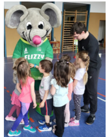
Maskottchen „Flizzy“ war zum Begegnungstag dabei

Mitte April wurde es sportlich im Kindergarten Eichigt: Im Rahmen des Interreg-Projekts „Nachbarsprache von Anfang an“ der Euregio Egrensis Sachsen/Thüringen e. V. durften die Eichigter den tschechischen Partnerkindergarten aus Hranice begrüßen. Gemeinsam erlebten die Kinder einen abwechslungsreichen und bewegungsreichen Vormittag, der ganz im Zeichen von Spiel, Sport und internationaler Begegnung stand. Ein besonderer Höhepunkt des Tages war die Abnahme des Kindersportabzeichens „Flizzy“, tatkräftig von der Sportjugend Vogtland unterstützt. An insgesamt sieben sportlichen Stationen konnten die Kinder ihr Können unter Beweis stellen. Gefragt waren Geschicklichkeit, Schnelligkeit, Ausdauer und Koordination. Mit großer Begeisterung meisterten die Kinder die einzelnen Stationen. Am Ende wurden alle für ihre tollen Leistungen belohnt. Mit großer Freude nahmen sie ihre Urkunden und einen Ansteckpin entgegen. Ein ganz besonderes Erlebnis war dabei die Übergabe durch das Maskottchen, die Sportmaus Flizzy. Im Anschluss an den sportlichen Vormittag, wurde noch gemeinsam in der Schulküche zu Mittag gegessen. Ein herzlicher Dank gilt allen, die diesen Tag ermöglicht und begleitet haben. Gefördert wurde das Projekt von Tandem - Koordinierungszentrum Deutsch-Tschechischer Jugendaustausch aus Mitteln des Deutsch-Tschechischen Zukunftsfonds.