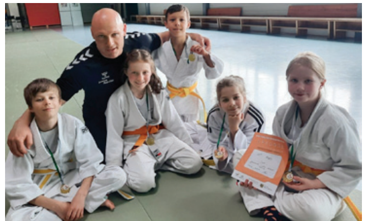
Die ASV-ler, die auch für die Grundschule in Chemnitz antraten