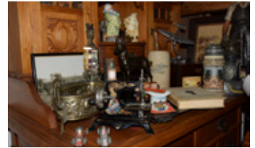
Ob Raritäten oder Liebhaberstücke: hier werden Interessierte fündig

Der nächste Floh- und Sammlermarkt auf dem Marktplatz in Oelsnitz/Vogtl. findet am Samstag, dem 13. Juni , in der Zeit von 7:00 bis 14:00 Uhr statt. Dieser lädt alle dazu ein, nach kleinen Schätzen, Raritäten und besonderen Fundstücken zu stöbern. Von Antiquitäten über Sammlerstücke bis hin zu Trödel und Kuriositäten - für Flohmarktfreunde