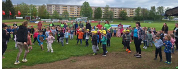
Die Freude am Bewegen stand im Vordergrund des Sportfestes

Anfang Mai trafen sich alle Oelsnitzer Kindertagesstätten mit ihren Vorschülern im Elstertalstadion zu einem fröhlichen Sportfest. Hier zeigten die Kinder ihr Können in den drei Disziplinen Ballweitwurf, Lauf und Weitsprung. Mit großer Begeisterung und lautem Anfeuern der Erzieherinnen und Eltern gaben alle kleinen Sportler ihr Bestes. Am Ende des sportlichen Vormittags wurden die besten feierlich ausgezeichnet. Doch im Vordergrund stand wie immer der Spaß an der Bewegung und das gemeinsame Erleben. Schon jetzt freuen sich alle Beteiligten auf das nächste gemeinsame Sportfest im kommenden Jahr.