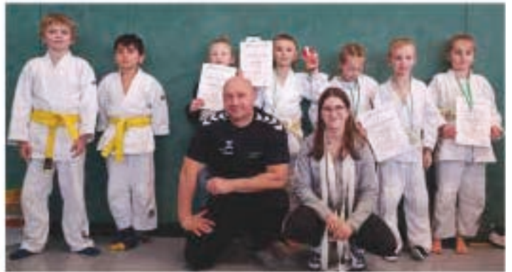
Erfolgreich beim Nikolausturnier in Langenhessen: die kleinen Judoka des ASV