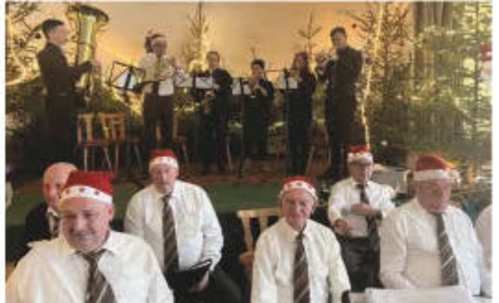
Mit Beifall waren die Auftritte des Mosen-Chores und des Bläser-Ensembles bedacht