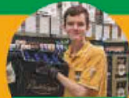
Ausbildung Einzelhandelskaufmann/-frau, Verkäufer:in (m/w/d) Vollzeit