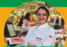
Ausbildung Metzgereifachverkäufer:in (m/w/d) Vollzeit