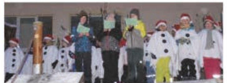
Die Kinder der Grundschule und des Kinderhauses boten ein abwechslungsreiches Programm