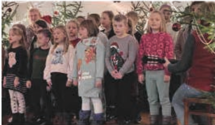
„Schneeflöckchen, Weißbröckchen“ - Kinder aus der Grundschule auf der Bühne im Bürgerhaus.