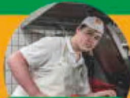
Ausbildung Fleischer:in (m/w/d) Vollzeit