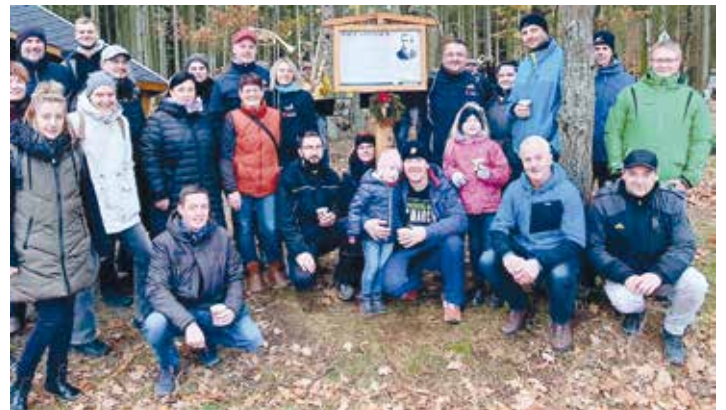
Die neu errichtete Gedenktafel zum bekannten Oelsnitzer ist nunmehr am „Apitzsch Blick“ zu besuchen