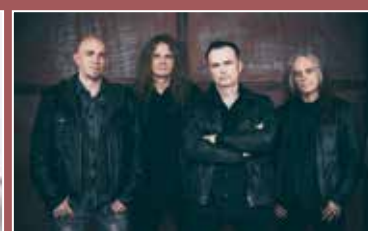
Blind Guardian

Weitere Souvenirs komplettieren das Angebot im Themenjahr. Neben Zollstöcken mit dem Motiv „Schloß Voigtsberg und Oelsnitz/Vogtl.“ sind auch T-Shirts, Kaffeetassen, Kissen, die beliebten Motiv-Kekse oder das Oelsnitz-Quartett stets ein gutes Mitbringsel und machen sich auch unter dem Tannenbaum als Weihnachtsgruß gut. Die anlässlich des Jubiläums aufgelegte Schneekugel mit dem Motiv der Burganlage ist sowieso immer eine gute Idee.