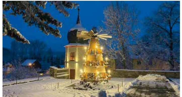
Die dienstälteste Großpyramide ist immer im Zentrum des Pyramidenfestes