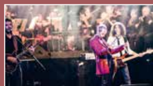
The Magic of Queen Classic