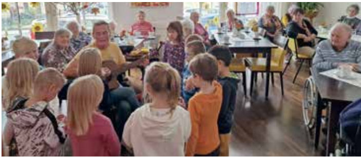
Die Kinder der Kita „Am Stadion“ sorgen für gute Stimmung bei den Bewohnern der Goldenen Sonne