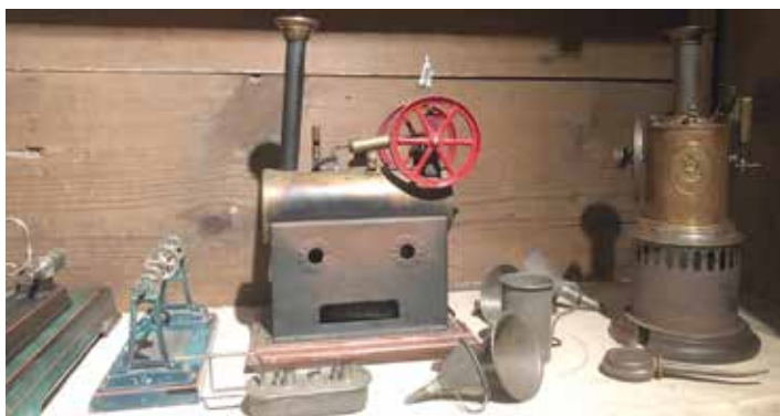
Eine Auswahl der Modelle, die Eingang in die Sonderschau gefunden haben