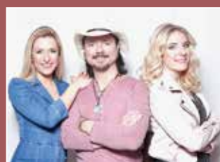
More Than Words © Stefanie Hertel-More Than Words