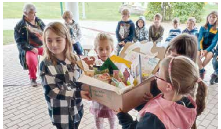
Stolz präsentierten die Kinder die liebevoll hergerichtete Leckerli-Kiste