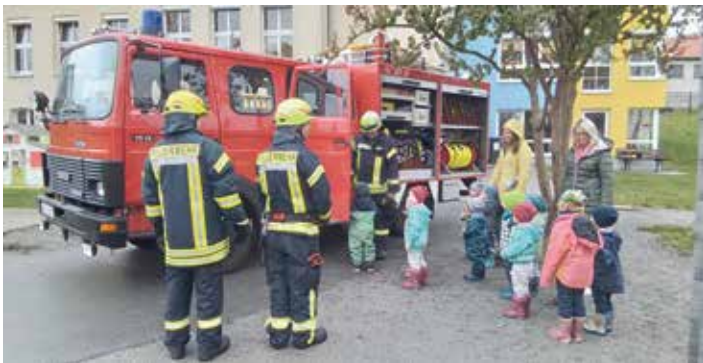
Aufgeregt inspizierten die Kinder das Feuerwehrfahrzeug

Ende Oktober waren die Kinder der „Villa Kunterbunt“ in Triebel sehr aufgeregt. Gegen 10:00 Uhr gingen die Rauchmelder an. Die Feuerwehrrübung kam für die Kinder völlig überraschend, die im Voraus besprochenen Fluchtwege wurden ordnungsgemäß benutzt und den Kindern der Sammelplatz gezeigt. Von diesem Sammelplatz aus konnten die Kinder das Geschehen gut beobachten. Rauch stieg aus der Kita auf, die Feuerwehr war sehr schnell zur Stelle. Besonders begeistert waren die Kleinen von der Vorführung nach dem Einsatz. Alle durften sich das Feuerwehrauto genau anschauen und erfuhren, was ein Feuerwehrmann alles braucht und bei sich trägt. Die beiden großen Gruppen der Kita hatten sogar die Möglichkeit, das Löschen einmal selbst auszuprobieren. Das Team der Kita möchte sich ganz herzlich bei der freiwilligen Feuerwehr Triebel für diesen tollen Tag bedanken.