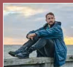
Florian Künstler

Weitere Souvenirs komplettieren das Angebot im Themenjahr. Neben Zollstöcken mit dem Motiv „Schloß Voigtsberg und Oelsnitz/Vogtl.“ sind auch T-Shirts, Kaffeetassen, Kissen, die beliebten Motiv-Kekse oder das Oelsnitz-Quartett stets ein gutes Mitbringsel und machen sich auch unter dem Tannenbaum als Weihnachtsgruß gut. Die anlässlich des Jubiläums aufgelegte Schneekugel mit dem Motiv der Burganlage ist sowieso immer eine gute Idee.