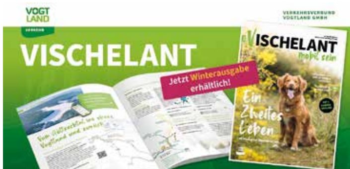
So ist die Winterausgabe erschienen

Die Winterausgabe des Kundenmagazins des Verkehrsverbundes Vogtland kommt diesmal tierisch daher. Denn die Titelgeschichte führt in das Tierheim Plauen, wo mit viel Engagement die Liebe zu Tieren sichtbar wird. Daneben widmet sich die Ausgabe auch dem BürgerBus Vogtland, ebenfalls eine besondere, ehrenamtliche Arbeit. Zudem ist die Ausgabe wieder gefüllt mit verschiedensten Ausflugstipps passend zur Jahreszeit u. a. Winterausflüge ins obere Vogtland, zum Märchenmarkt im thüringischen Gera oder auf die Burg Loket in der Karlsbader Region. Interessante Zahlen und Fakten zum Busverkehr im Vogtlandnetz, Informationen zum Bahnfahrplanwechsel im Dezember und Neues zur App VVV mobil sind ebenfalls im Magazin zu finden. Das Kundenmagazin des Verkehrsverbundes ist wieder vogtlandweit erschienen und kann kostenlos in Bus und Bahn mitgenommen werden. Es liegt u. a. in den Kommunen und Tourist-Informationen aus bzw. kann unter www.vogtlandauskunft.de/vischelant eingesehen oder bestellt werden.