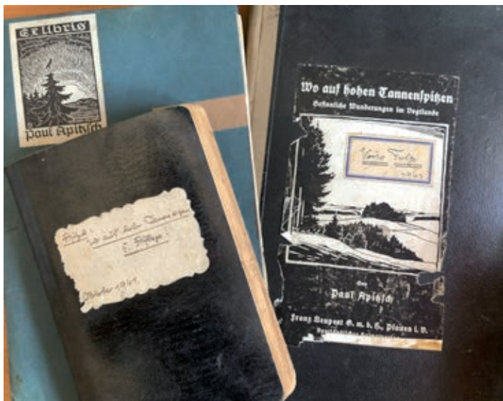
Handschriftliche Notizen und Manuskripte aus dem Nachlass