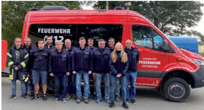
Freude am sanierten Tiefenbrunner Gerätehaus! Die Kameraden haben ein neues Löschfahrzeug in Besitz genommen.