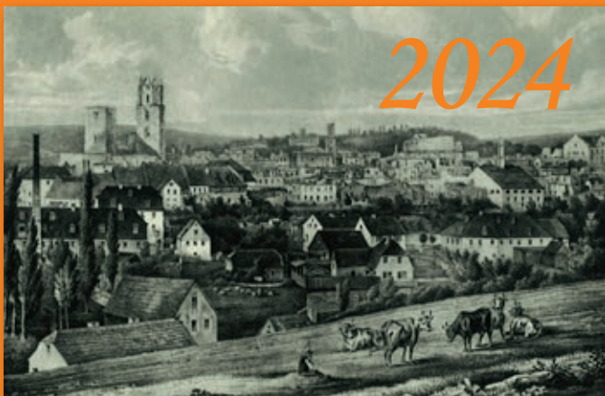
Oelsnitz/Vogtl. in historischen Ansichten

erhältlich ab Anfang November in der „Buchhandlung am Markt“ in Oelsnitz/Vogtl.