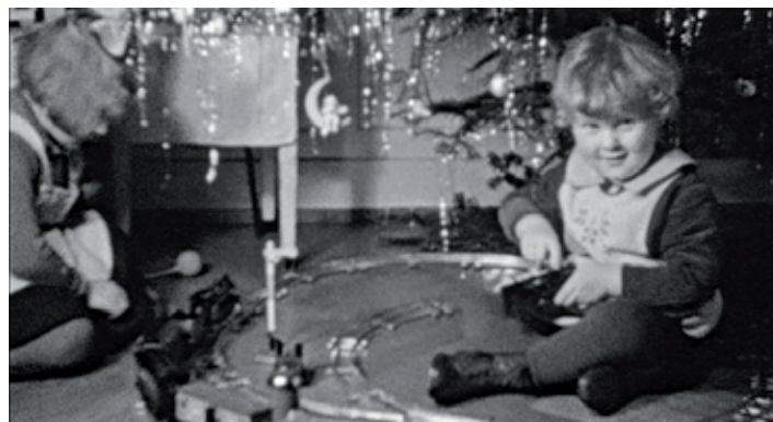
Unter dem Tannenbaum freuen sich die Kleinen - Ausschnitt aus privaten Filmaufnahmen, Weihnachten 1925