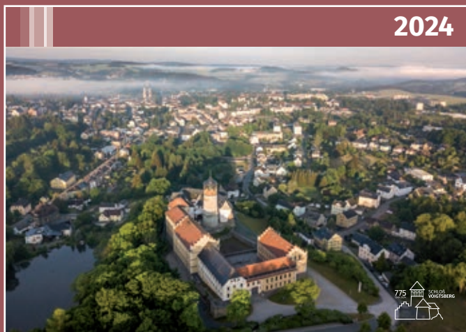
Kalender „775 Jahre Schloß Voigtsberg“, „Oelsnitz historisch“ und „Künstlerkalender Schloß Voigtsberg“

Zudem sind anlässlich des Themenjahres ab November auch die beliebten Souvenir-Geldscheine mit dem Motiv der Burganlage erhältlich. Während der eine 0-Euro-Schein auch über das Jahr 2024 erhältlich sein wird, ist der andere anlässlich des Jubiläums nur in einer Auflage von 1.500 Stück erhältlich und berechtigt - ausgewiesen durch die jeweilige Seriennummer - dann auch zum Besuch der zu Pfingsten startenden Sonderschau „Kinder für die Macht – Das Haus Habsburg“. Das „allgemeine“ Motiv ist bereits für vier Euro erwerbbar, das Sondermotiv „775 Jahre Schloß Voigtsberg“ ist – inklusive Eintritt – zu 8,00 Euro erhältlich.