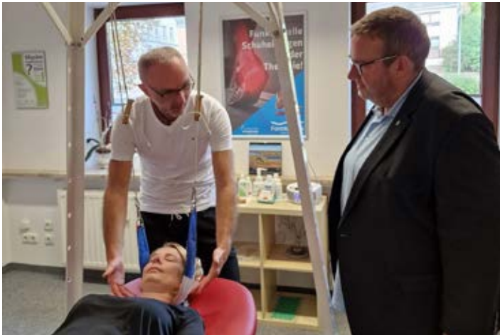
Erklärung von Therapie Anwendungen am sogenannten Schlingentisch